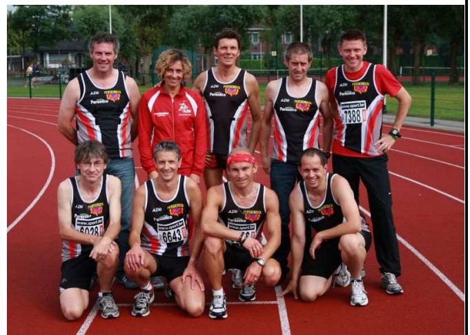
De AZW masters die het behoud verzekerden. Erwin dewulf ontbreekt op de foto.

Dit dreamteam slaagde er uiteindelijk moeiteloos in om zich te handhaven in 2e afdeling : met een 9e plaats was de opdracht meer dan volbracht.