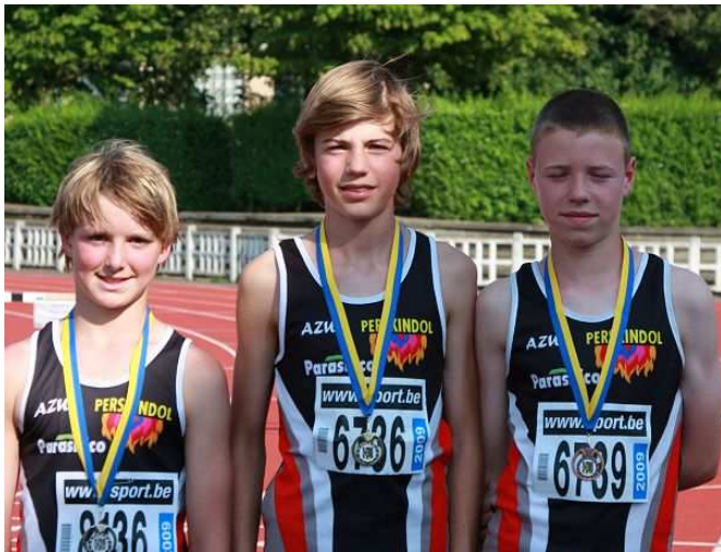
Een volledig AZW podium bij het hoogspringen